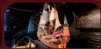
พิพิธภัณฑ์วีกา