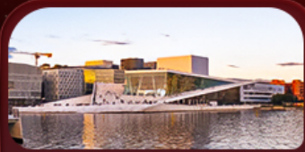
OSLO OPERA HOUSE