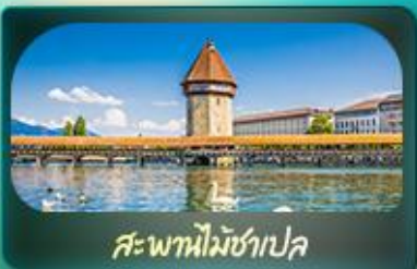
สะพานไมซ์าเปลา