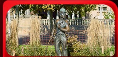
ชาร์ลี แซปลิน