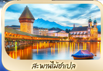
สะพานไมซ์าเปล