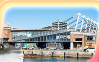
ตลาดปลาอาราโตะ