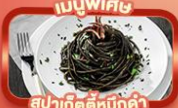
สปาเก็ตตี้หมักดำ