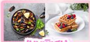
เมนูพิเศษ หอยมัสเซล+วาฟเฟิล