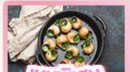
เมนูพิเศษ หอยออสตาโก้

เยอรมัน เนเธอร์แลนด์ เบลเยียม ฝรั่งเศส Keukenhof