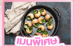
เมนูพิเศษ หอยเอสคาโท

เยอรมัน เนเธอร์แลนด์ เบลเยียม ฝรั่งเศส Keukenhof