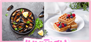
เมนูพิเศษ หอยมัสเซล+วาฟเฟิล