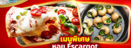
เมนูพิเศษ หอย Escargot Pizza Margherita 1 ถาด

อิตาลี มหาวังศูโลก ชมสิ่งมหัศจรรย์โลก โคโลสเซียน หอเอนปิซ่า สวิส พีชียอดเขาจุงเฟรา "TOP OF EUROPE" สะพานไม้ชาเปล รูปปั้นสิงโต ฝรั่งเศส เซ็งติอันปารีส หอไอเฟล ประตูชัย นั่งรถกระเช้าไฟฟ้ามงต์มาตร์ ล่องเรือแม่น้ำแซนชมเมือง ซ็อมบียงแบรนต์เนมห้างปลอดภาษี เฮกท์เล็ก