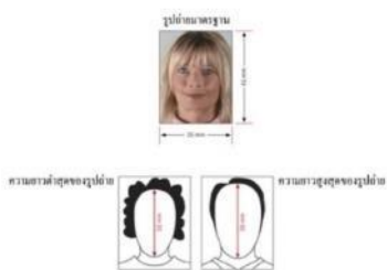
รูปถ่ายมาตรฐาน