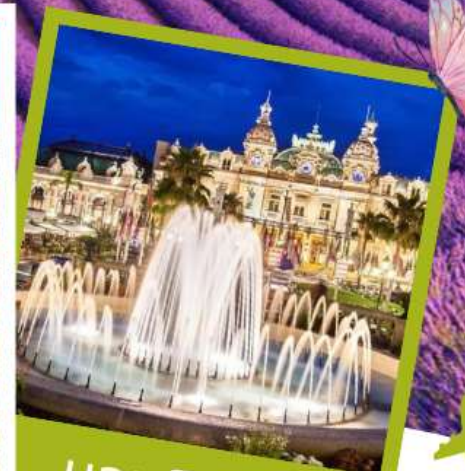
มอนติคาร์โร