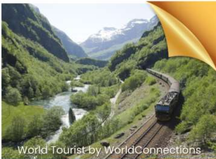
World Tourist by WorldConnections