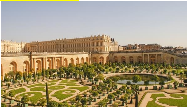
ไกด์ประจำพระราชวังคอยบรรยายตาม

โดดเด่นที่สำคัญๆของพระราชวัง จัดเป็น 1 ใน 7 สิ่งมหัศจรรย์ของโลกยุคปัจจุบัน เพราะความสวยงามใหญ่โตของตัวปราสาท และสวนดอกไม้ที่มีการตกแต่งไว้อย่างสวยงามผู้ที่ก่อสร้างพระราชวังแวร์ซายส์ที่งดงามแห่งนี้ คือ พระเจ้าหลุยส์ที่ 14 ของฝรั่งเศส พระราชวังในอดีตแห่งนี้มีพื้นที่ประมาณถึง 37,000 ไร่ แต่ปัจจุบันนั้นพื้นที่ บางส่วนถูก