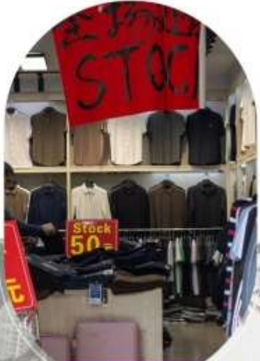
ตลาดค้าส่งอู่