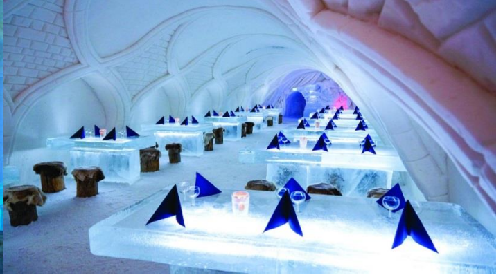
เที่ยง บริการอาหารกลางวัน ณ ภัตตาคาร