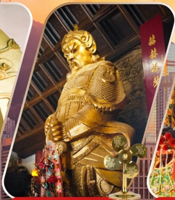
CHE KUNG (SHA TIN)