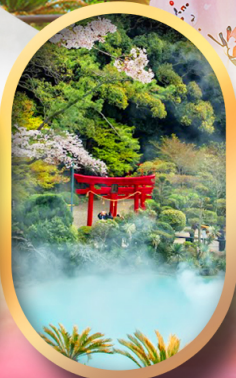
อุมิจิกุคุ