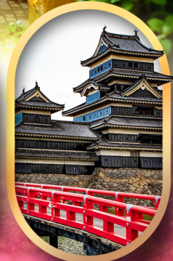
ปราสาทคумаโมโตะ