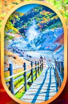
หุบเขานรกจิกุคุดาบี