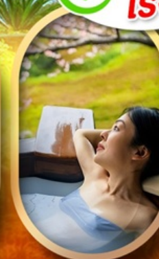
แช่ออนเซ็นญี่ปุ่น