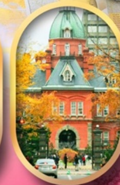
ศาลาว่าการเก่า