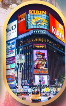
ช้อปปิ้งย่านซูซุกิโนะ