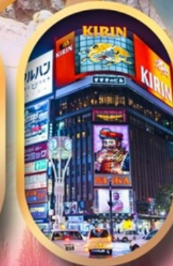
ช้อปปิ้งย่านซูซุกิโนะ