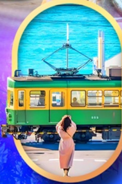
ถนนโคมาจิโคริ