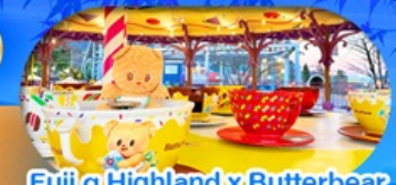
Fuji q Highland x Butterbear เดินทาง พ.ศ. 69 เป็นต้นไป