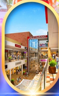
มิตซุยอ่ากาลีต