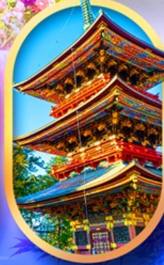
วัดนาริตะซัน