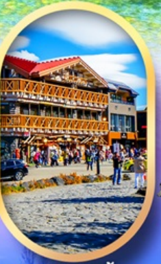
ภูเขาไฟฟูจิ ชั้น 5