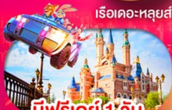
มีฟรีเดย์ 1 วัน