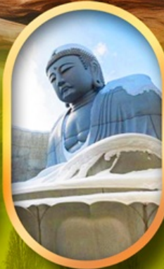
เนินเขาแห่งพระพุทธรเจ้า