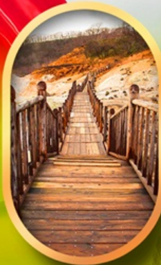
หุบเขาจิกุกดาบิ