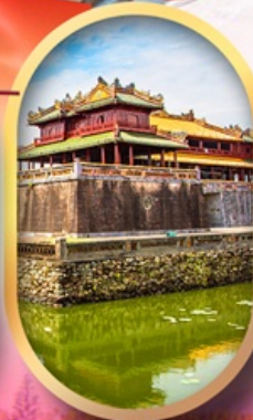
พระราชวังไคโน้ย