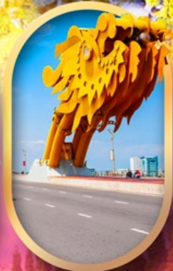
สะพานมังกรดานัง