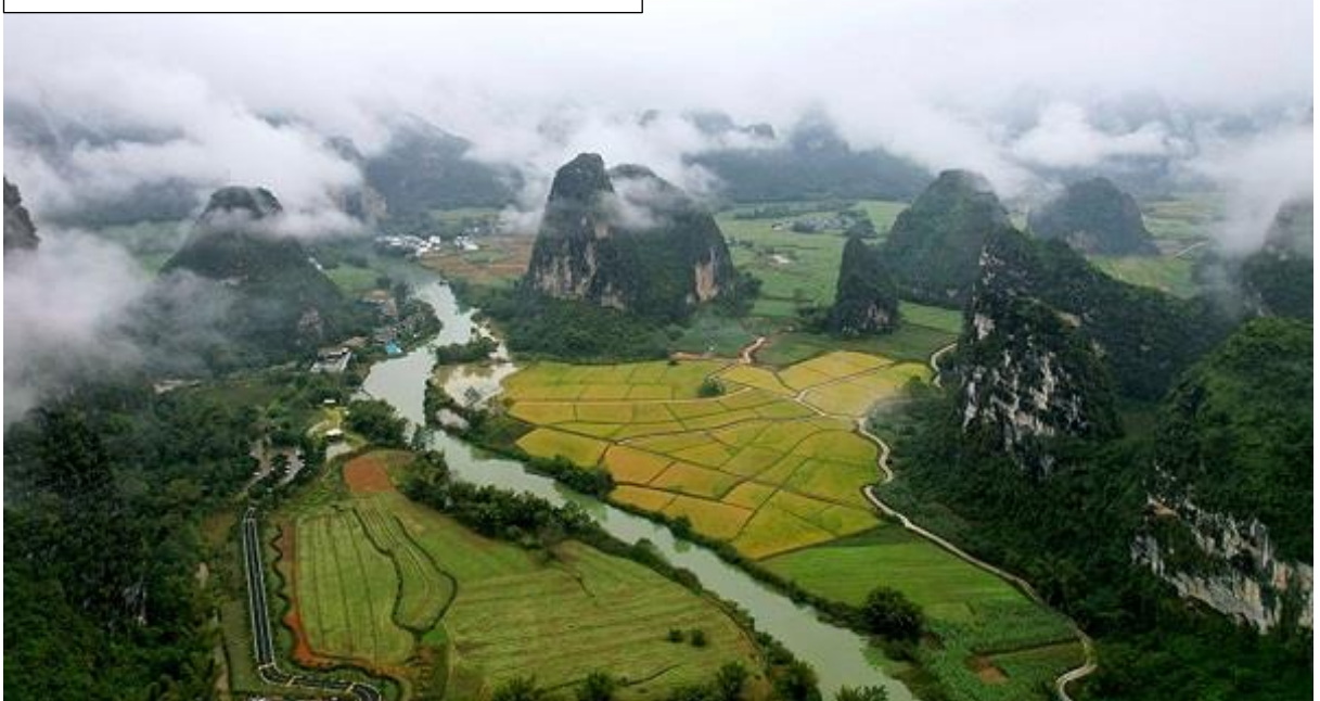
An aerial view of the Mingshi scenic area.

แม่น้ำหมิงซือ Mingshi มีต้นกำเนิดในเวียดนาม และไหลจาก Niandoutun เข้าสู่ประเทศจีน ซึ่งไหลไปทางตะวันออกเฉียงใต้ Jingtang, Mingshi, Kanwei, Lushan, Houyi ฯลฯ ในที่สุดแม่น้ำหมิงซือก็ไหลมาบรรจบกับแม่น้ำเฮยฮุย มีความยาวทั้งสิ้น 44.13 กิโลเมตร