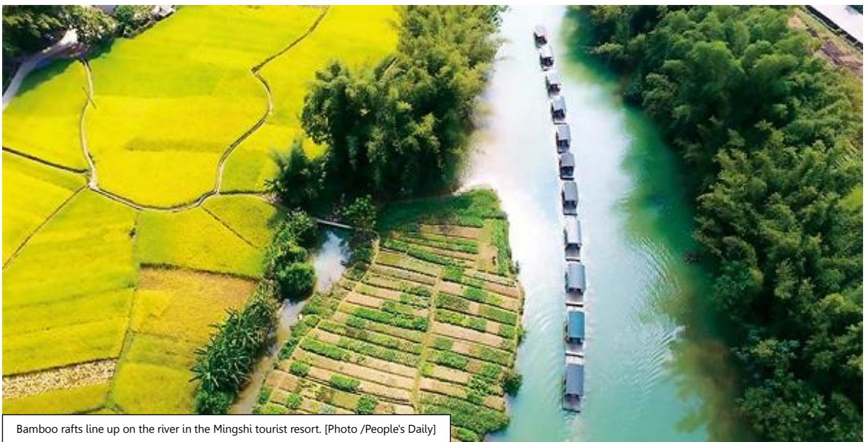
Bamboo rafts line up on the river in the Mingshi tourist resort.

แม่น้ำหมิงซือ Mingshi มีต้นกำเนิดในเวียดนาม และไหลจาก Niandoutun เข้าสู่ประเทศจีน ซึ่งไหลไปทางตะวันออกเฉียงใต้ Jingtang, Mingshi, Kanwei, Lushan, Houyi ฯลฯ ในที่สุดแม่น้ำหมิงซือก็ไหลมาบรรจบกับแม่น้ำเฮยฮุย มีความยาวทั้งสิ้น 44.13 กิโลเมตร