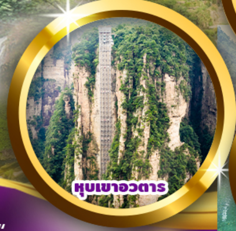
หุบเขาวอถาร