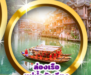
ล่องเรือ แม่น้ำถั่วเจียง