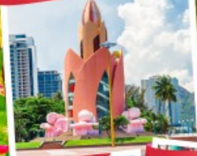
Nha Trang Cathedral