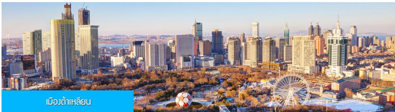
เมืองต้าเหลียน