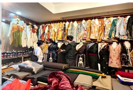
ศูนย์จำหน่ายอุปกรณ์กันหนาว