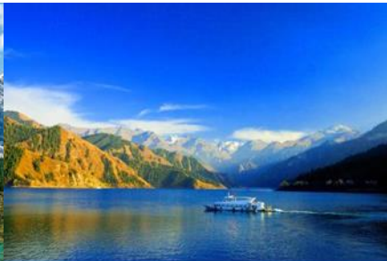
ล่องเรือทะเลสาบเทียนฉือ