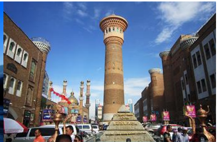
ตลาดต้าปาจา