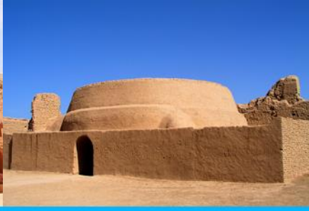
เมืองโบราณกาซางกูเจิง