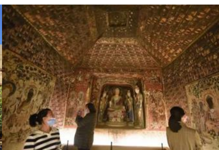
ชมภาพยนตร์ 3 มิติ