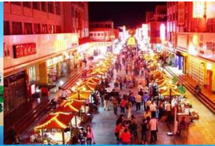
ตลาดกลางคืน ซาโจว