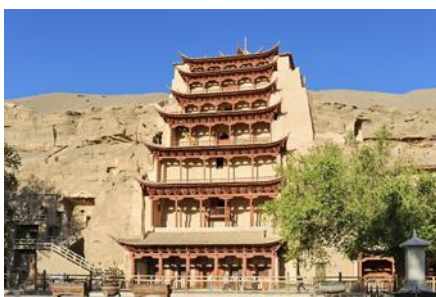
ถ้ำหินมั่วเกา

พักที่ METRO PARK HOTEL โรงแรมระดับ 4 ดาวหรือเทียบเท่าในเมืองตุนหวง