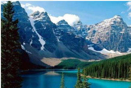
ภูเขาเทียนชาน

พักที่ HAMPTON BY HILTON URUMQI HOTEL โรงแรมระดับ 4 ดาวหรือเทียบเท่าในเมืองอูรูมูฉี