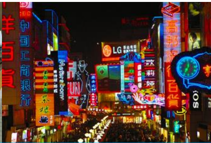
ถนนคนเดินซุนซีลู่