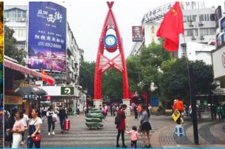
ถนนคนเดิน เจิ้งหยางลู่