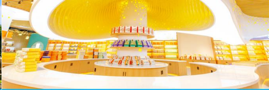
พิพิธภัณฑ์ดอกกุยฮวา