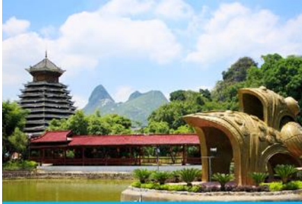
สวนหลิวซานเจีย