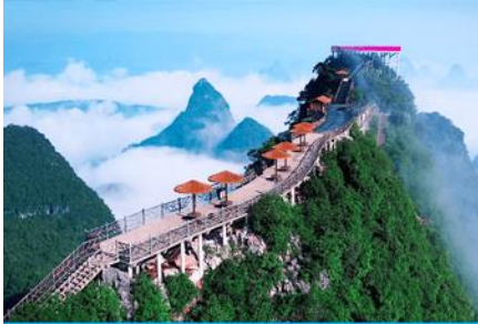
นั้งกระเช้าขึ้นเขาหฺรูยี้ฟง