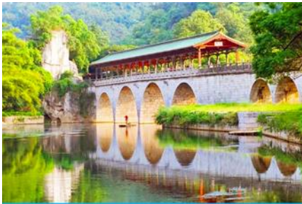
สวนเจ็ดดาว

พักที่ GUILIN VIENNA HOTEL ระดับ 4 ดาวท้องถิ่นหรือเทียบเท่าใน เมืองกุ้ยหลิน