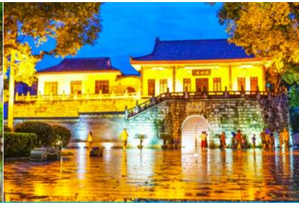
ประตูเมืองโบราณกุหนานเหมิน