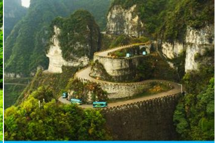
เส้นทาง 99 โค้ง