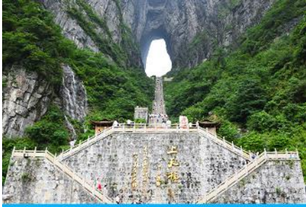
ประตูสวรรค์