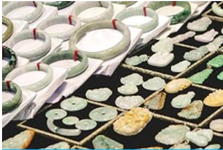
ศูนย์จำหน่ายผลิตภัณฑ์หยก

พักที่ ZHENMIAN HOTEL โรงแรมระดับ 4 ดาวหรือเทียบเท่า