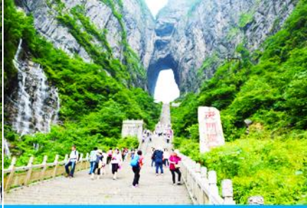
บันได 999 ขั้น