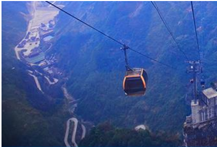
กระเช้าขึ้นเขเทียนเหมินซาน

https://hk.trip.com/hotels/guzhang-hotel-detail-68614854/chaxitai-holiday-hotel/