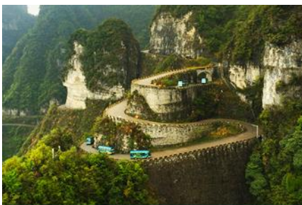
เส้นทาง 99 โค้ง