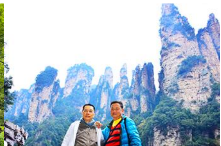
ชมจุดชมวิวลีฟกัแก้ว