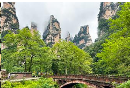
จุดชมวิวจินเปียนซี