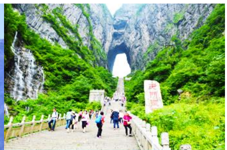
บันได 999 ขั้น