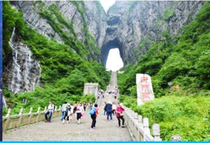
ประตูสวรรค์