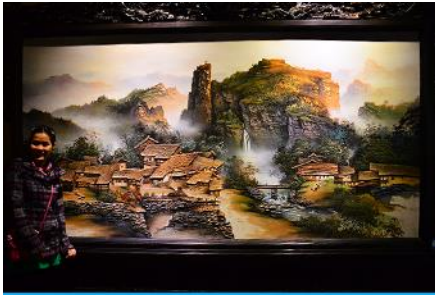
พิพิธภัณฑ์ภาพหินทราย