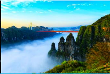
อุทยานป่าไม้แห่งชาติไ้อ้าย