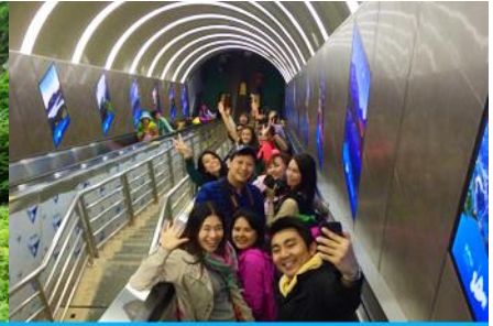
บันไดเลื่อนทะเลภูเขา

วันที่สาม จางเจียเจีย-ศูนย์สมุนไพรจีน-ผลิตภัณฑ์ยางพารา-กระเช้าขึ้น-ลง เทียนเหมินซาน รวมค่าบัตรทุกอย่าง อย่าง ประตูสวรรค์ – ระเบียงแก้วเลียบน้ำผา – บันไดเลื่อนทะเลภูเขา – (เลือกซื้อโปรแกรมเสริม โชว์ จิ้งจอกขาว)