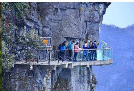
หน้าผาลอยฟ้าทางเดินกระจก