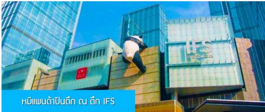
หมีแพนด้าปิ่นตึก ณ ตึก IFS

พักที่ DAGU GLACIER HOTEL 4* หรือ โรงแรมระดับเดียวกันพื้นเมือง