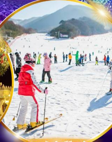
สโนว์สกีรีสอร์ท

ชมจอ LED ขนาดยักษ์ที่รีสอร์ท 5 ดาว ใหญ่ที่สุดในเอเชียเหนือ สัมพัสหิมะสกีรีสอร์ท สโนว์สกีรีสอร์ท สวนสนุกเอเวอร์แลนด์ ชมพระราชวังคยองบกกุง ย้อนอดีตหมู่บ้านบุกซอน อันอก อิสระช้อปปิ้งคังนัม Lotte Duty Free