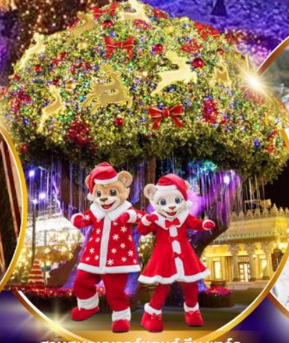
สวนสนุกเอเวอร์แลนด์ ฮิม พาร์ค