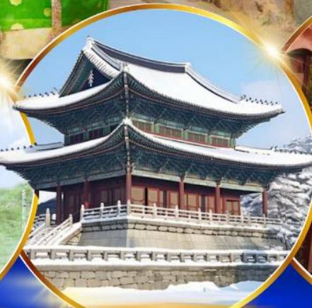
พระราชวังเคียงบกคยอง