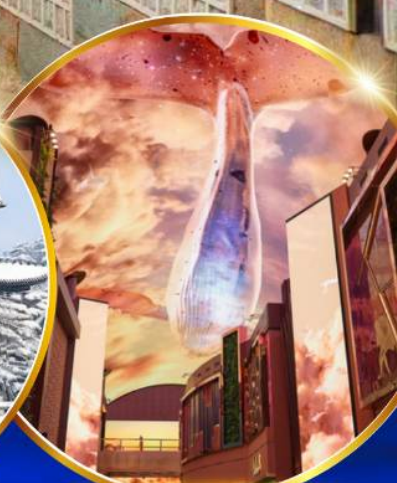
INSPIRE Entertainment Resort

ชมจอ LED ขนาดยักษ์ที่รีสอร์ท 5 ดาว ใหญ่ที่สุดในเอเชียเหนือ ชมพระราชวังคยองบกคยอง ย้อนอดีตหมู่บ้านบุคซอน อันอก ใส่ชุดฮันบก ทำข้าวห่อสาหร่าย อิสระช้อปปิ้ง Lotte Duty Free