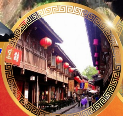
ถนนโบราณจีนหลี