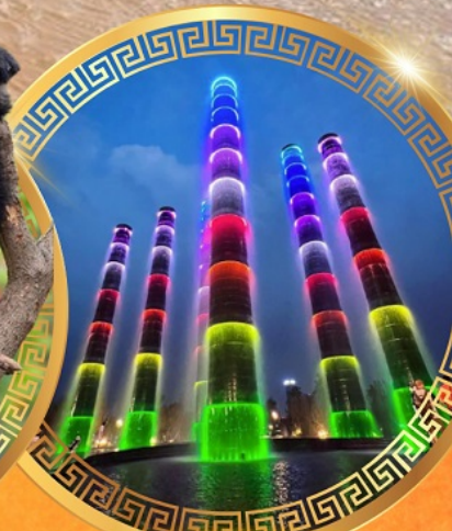
ชมการแสดงแสงสี