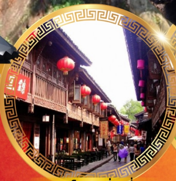
ถนนโบราณจินหลี่