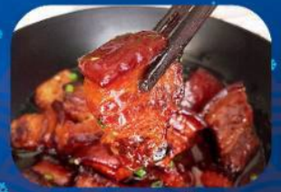
พิเศษ!! หมูสามชั้นน้ำแดง