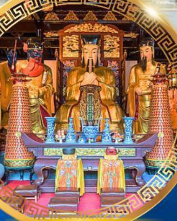
ศาลเจ้าพ่อหลักเมือง