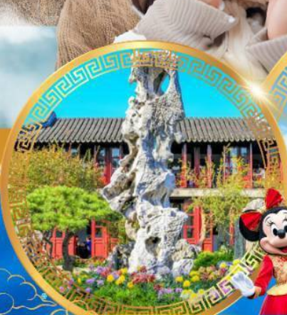
สวนหลิวหยวน