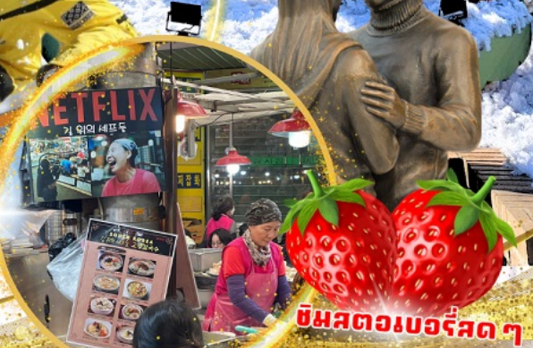
ตลาดกวางจง