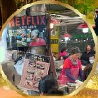
สตรีทฟู้ดตลาดกวางจ็อง