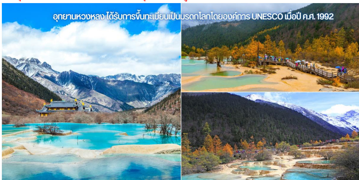
อุทยานหวงหลง ได้รับการขึ้นทะเบียนเป็นมรดกโลกโดยองค์การ UNESCO เมื่อปี ค.ศ. 1992

หมายเหตุ ** ใบบไม้เปลี่ยนสีและหิมะภายในอุทยานขึ้นอยู่กับสภาพ อากาศในแต่ละปี