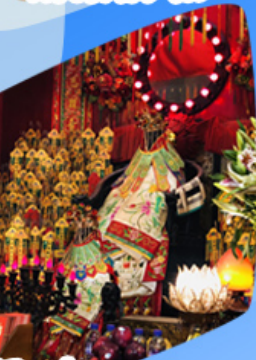
เจ้าแม่กวนอิมซี่มเงิน

วัดเจ้าแม่กวนอิมรัมทะเล วัดเจ้าแม่กวนอิมมาแก้ว แถมวัดซ่งซาน