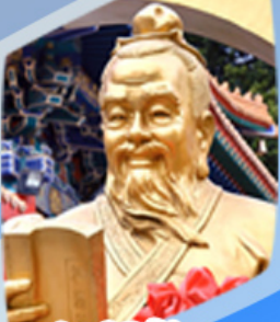
หลวงดำเซ็งน