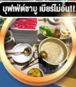
บุฟฟัตชาบู เมื่อรไรอิน!!