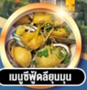
เมนูซีฟู้ดลิขุมบอน