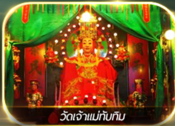
วัดเจ้าแม่กิมทิม