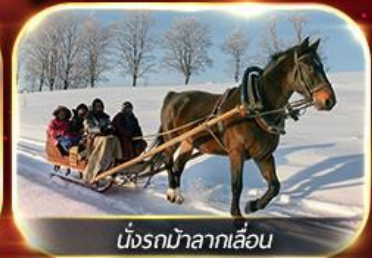
นั่งรถม้าลากเลื่อน

ฟรีนั่งรถม้าลากเลื่อน ชมโชว์ว่ายน้ำน้ำแข็ง แม่น้ำชงหวาเจียง