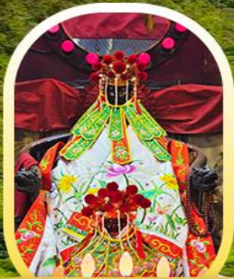
เจ้าแม่กวนอิมฮ่องฮำ