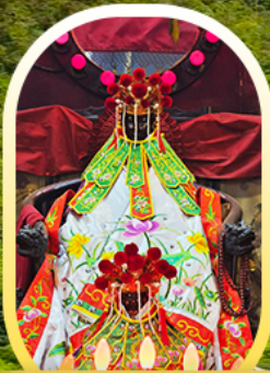
เจ้าแม่กวนอิมฮ่องฮำ