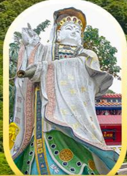
วัดเจ้าแม่กวนอิมรี พลัสเบย์