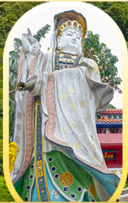
วัดเจ้าแม่กวนอิมรี พลัสเบย์