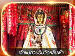
เจ้าแม่กวนอิมวัดหลินฟ้า