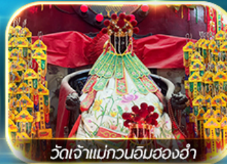
วัดเจ้าแม่ทวนอิมฮ่องกง