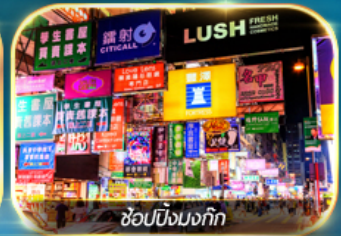
ช้อปปิ้งมณฑก

เต็มอิ่มทั้งบุญ และ ช้อปปิ้งแบบจัดเต็ม จิมซาจู้ย มงก๊ก