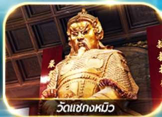
วัดเซ็กกวมิว