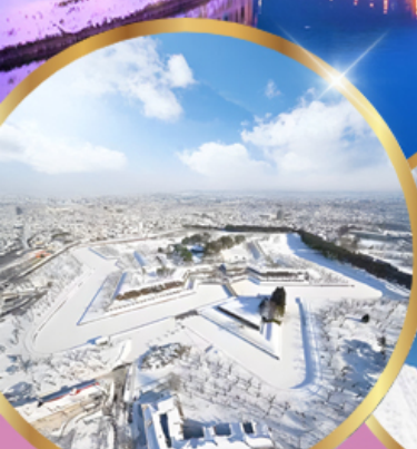
ป้อมโทเรียวคาคุ