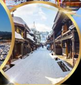
ตากายาม่า